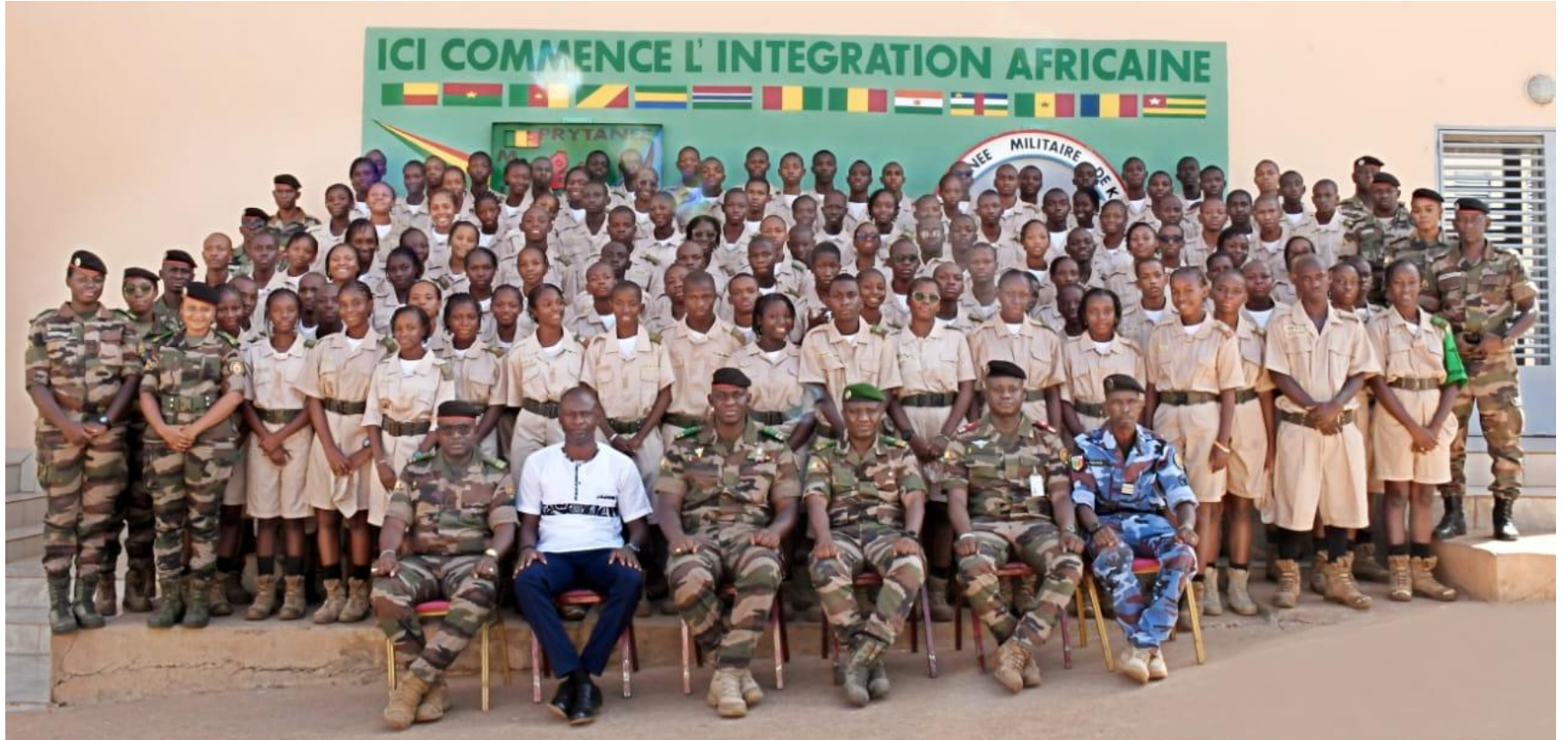
Droit International Humanitaire (DIH 1-26 MALI) Prytanée Militaire (Kati, Mali) Du 22 au 26 Juin 2026