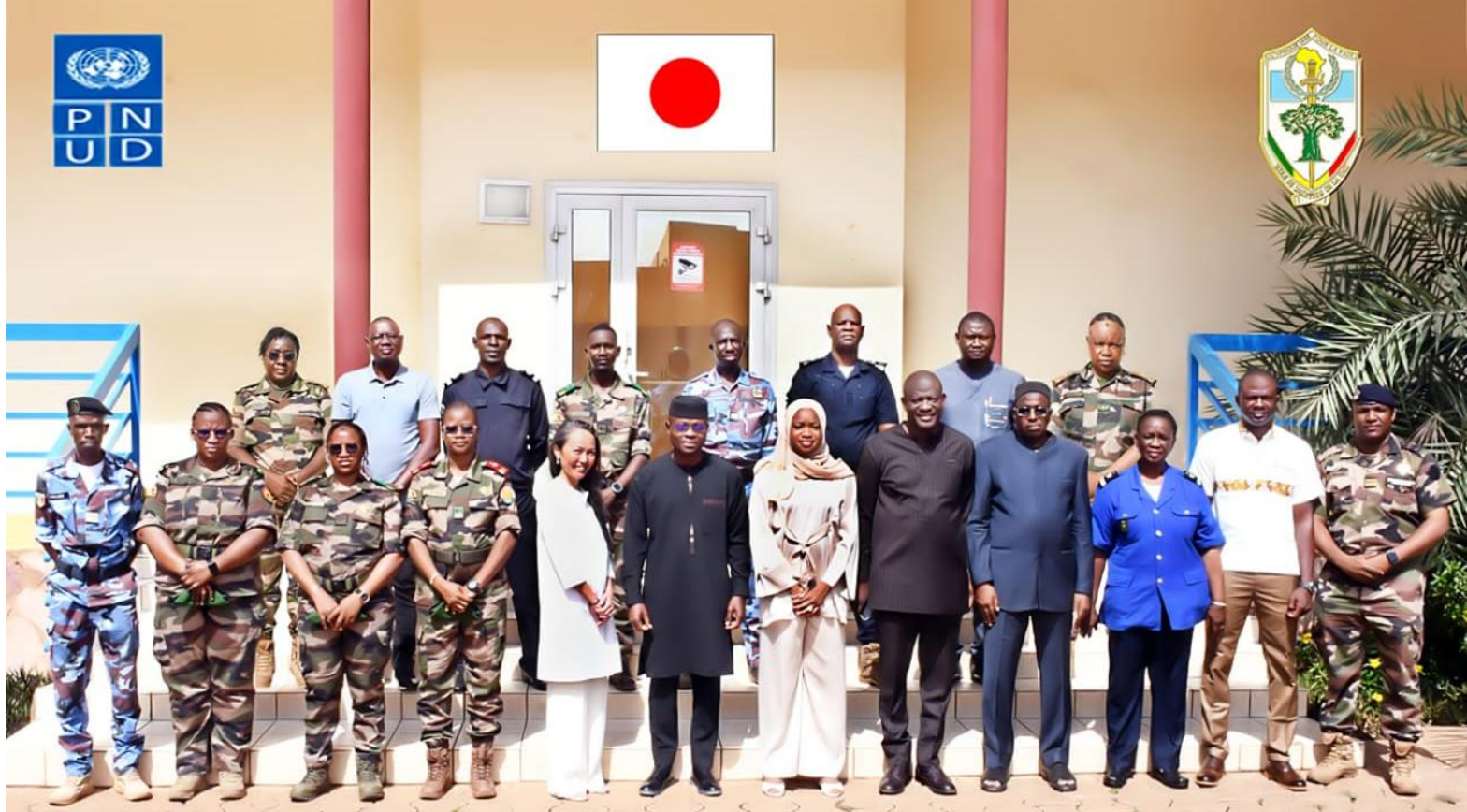
Violences Sexuelles en Situation de Conflit (VSSC 1-26 JPN) EMP-ABB Du 15 au 19 Juin 2026