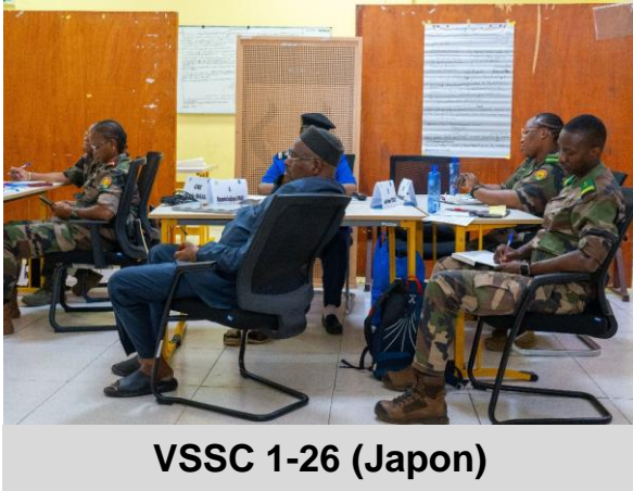
VSSC 1-26 (Japon)

Violences Sexuelles en Situation de Conflit (VSSC)