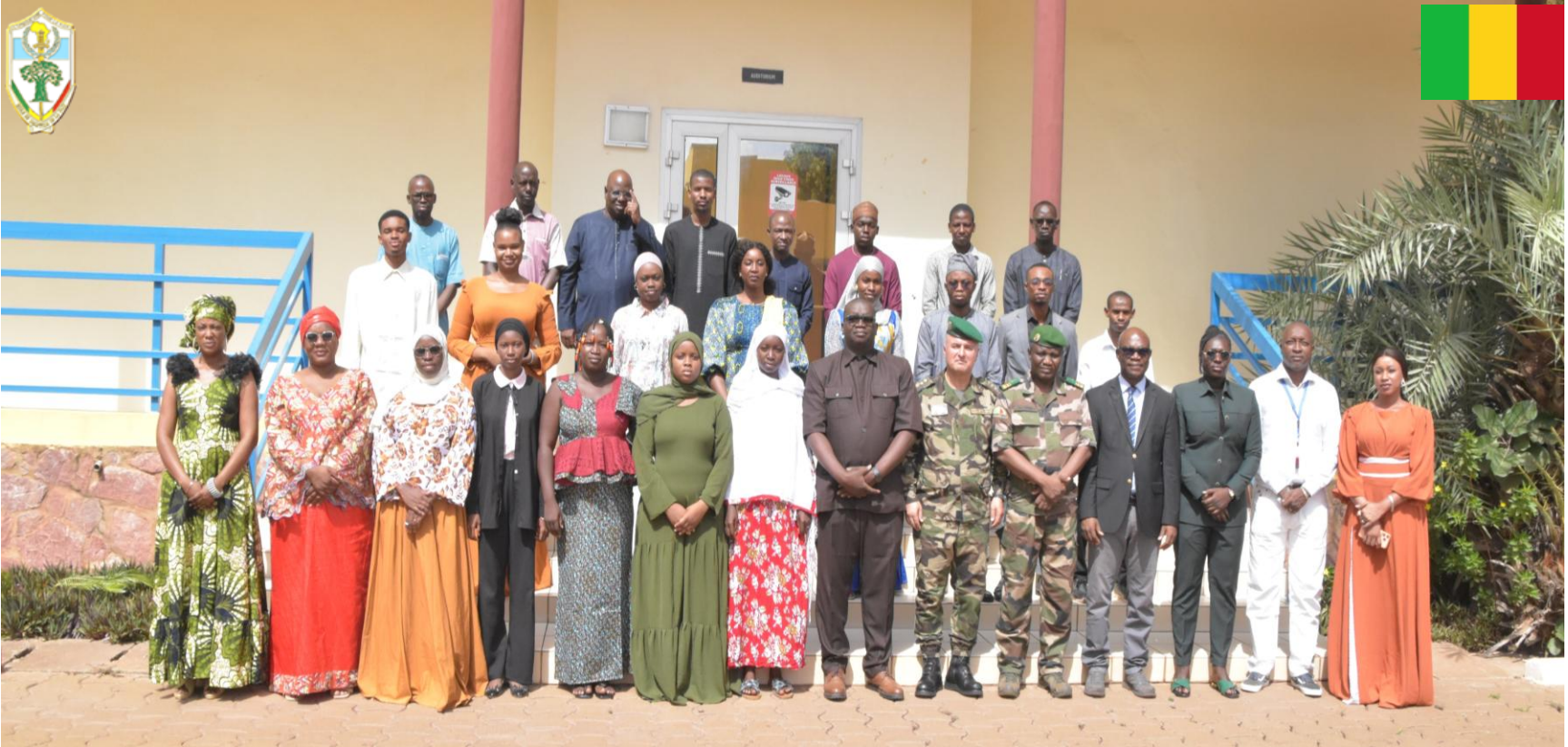
Droits de l'Homme (DH 1-26) EMP-ABB Du 11 au 22 Mai 2026