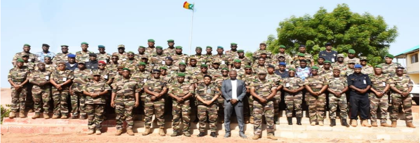
Logistique des Nations-Unies (UNLOG 1-26) Ecole Militaire d'Administration (Kati /Mali) Du 04 au 15 Mai 2026