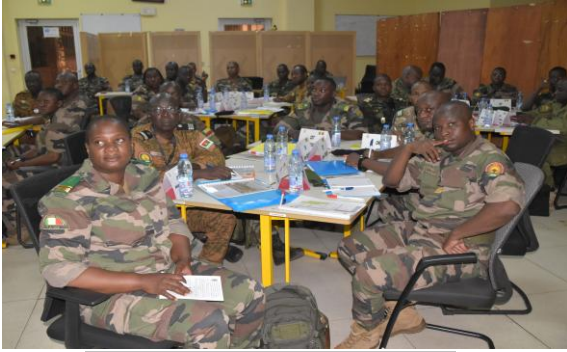
PC BAT 1-26 ( MALI)

Poste de Commandement Bataillon ( PC BAT )