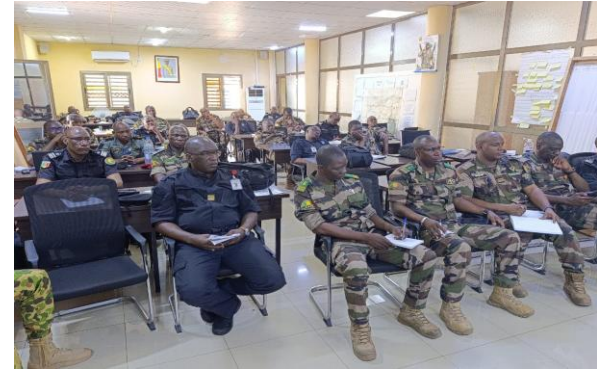
PC BAT 2-26 (MALI )

Acquisition des connaissances et du savoir-faire indispensables aux officiers d'État-major de bataillon engagés dans une Opération de Soutien à la Paix de l'Union Africaine ou dans une Opération de Paix de l'ONU.