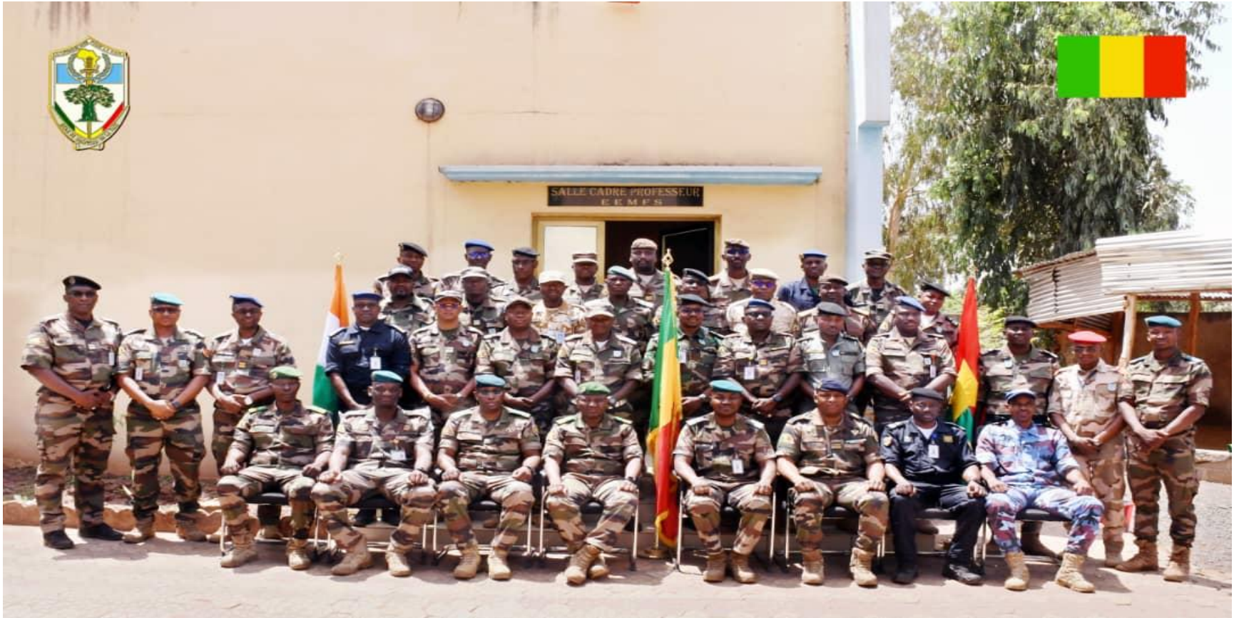
Poste de Commandement Bataillon (PC BAT 2-26) Ecole d'Etat-Major des Forces de Sécurité (Faladiè/Mali) Du 04 au 15 Mai 2026