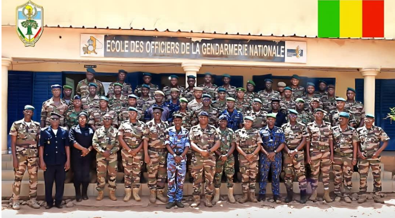
Police des Nations-Unies (UNPOL 1-26) Ecole des Officiers de la Gendarmerie Nationale (Faladiè/Mali) Du 11 au 22 Mai 2026