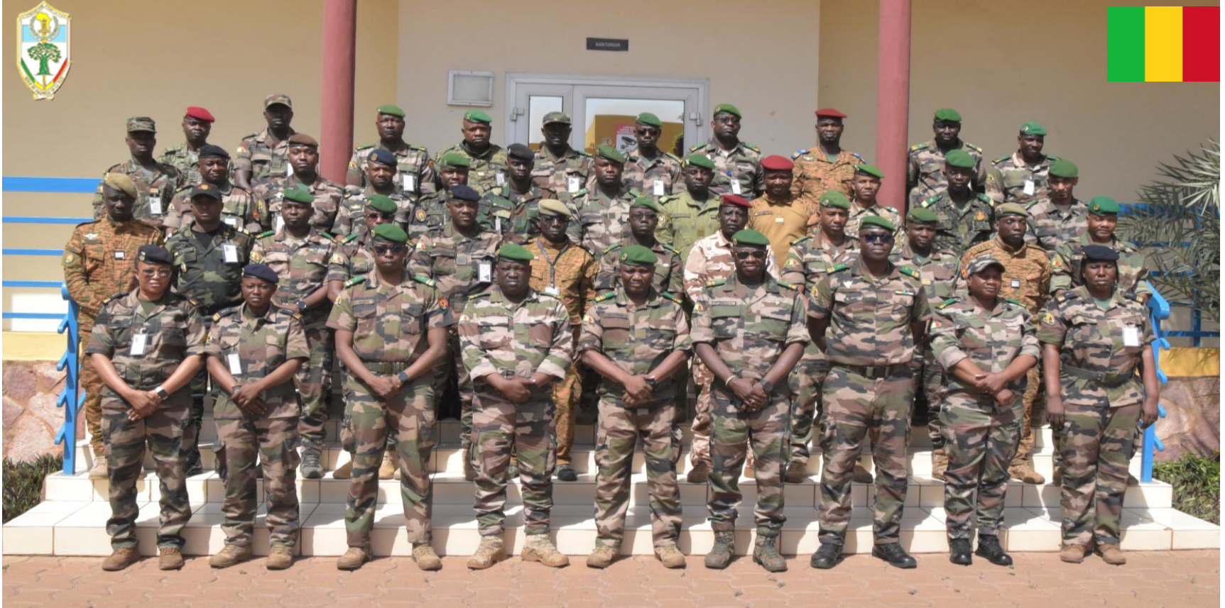
Poste de Commandement Bataillon (PC BAT 1-26 EEMC) EMP-ABB Du 04 au 15 Mai 2026