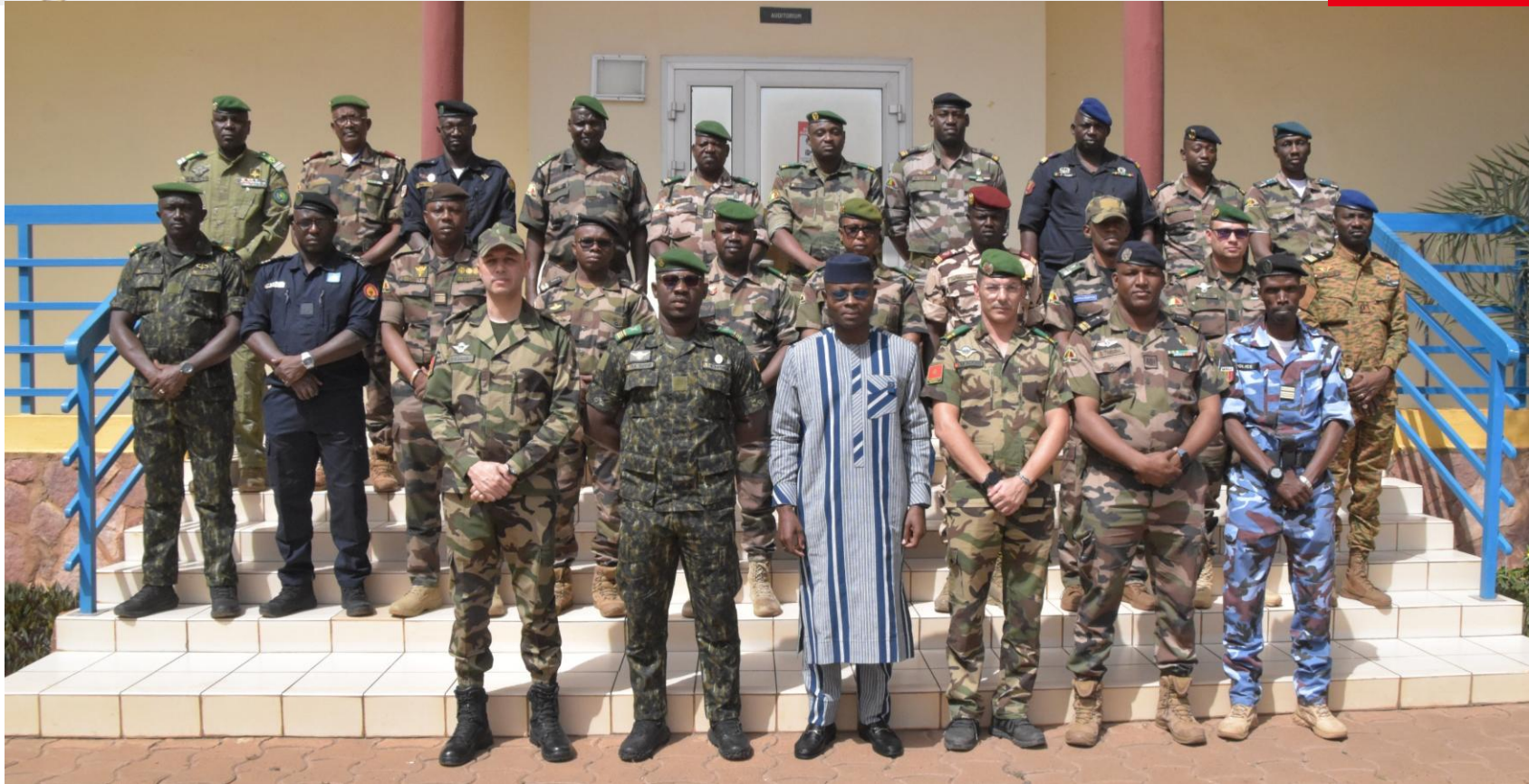
Cours des Officiers d'Etat-major des Nations Unies (UNSOC 1-26 Maroc) EMP-ABB Du 13 au 30 Avril 2026