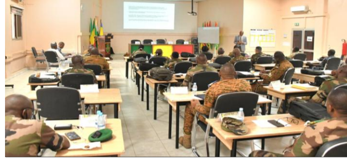
SHN OMP 1-26 ML

Fournir aux Elèves Sous-Officiers une connaissance de base dans le domaine des Opérations de Paix.