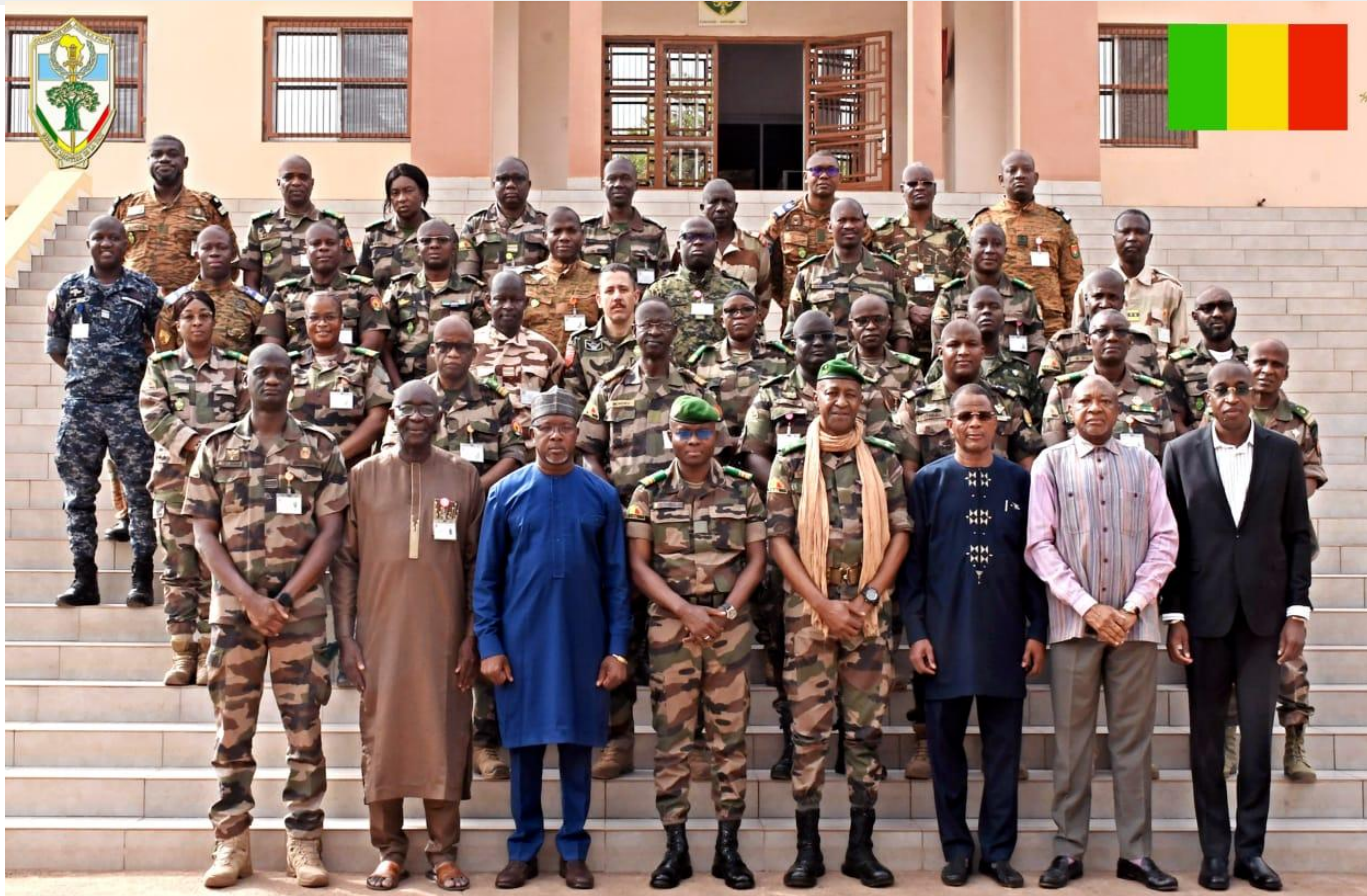
Séminaire de Haut Niveau sur les Opérations de Maintien de la Paix (SHN OMP 1-26 MALI) Ecole de Guerre du Mali (Bamako, Mali) Du 23 au 27 Mars 2026