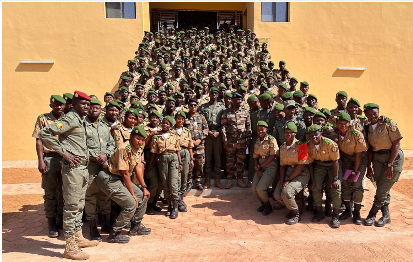
Sensibilisation sur les Opérations de Maintien de la Paix (S-OMP ESO 1-26 MALI) Ecole des Sous-Officiers (Banankoro, Mali) Le 13 Mars 2026