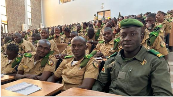
S-OMP ESO 1-26 ML

Sensibilisation sur les Opérations de Maintien de la Paix ( CONFOND )