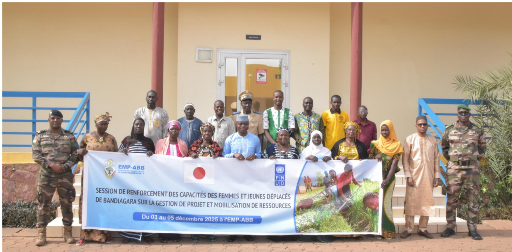
Gestion de Projet et Mobilisation des ressources (GPMR) EMP-ABB (Bamako, Mali) Du 01 au 05 décembre 2025