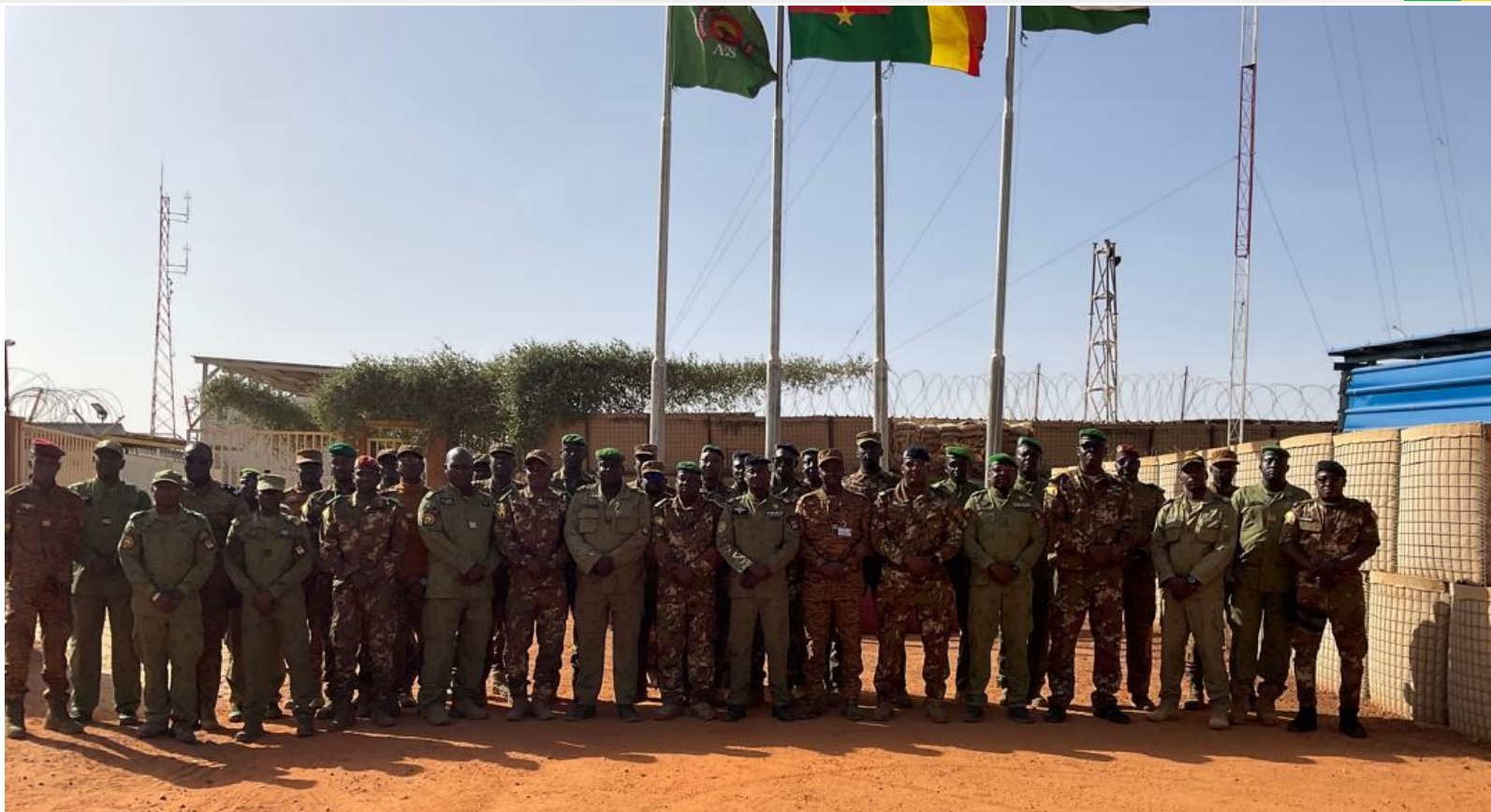
Poste de Commandement de la Force Unifiée de la Confédération des Etats du Sahel ( PC-FU AES) Niamey (Niger) Du 08 au 19 décembre 2025