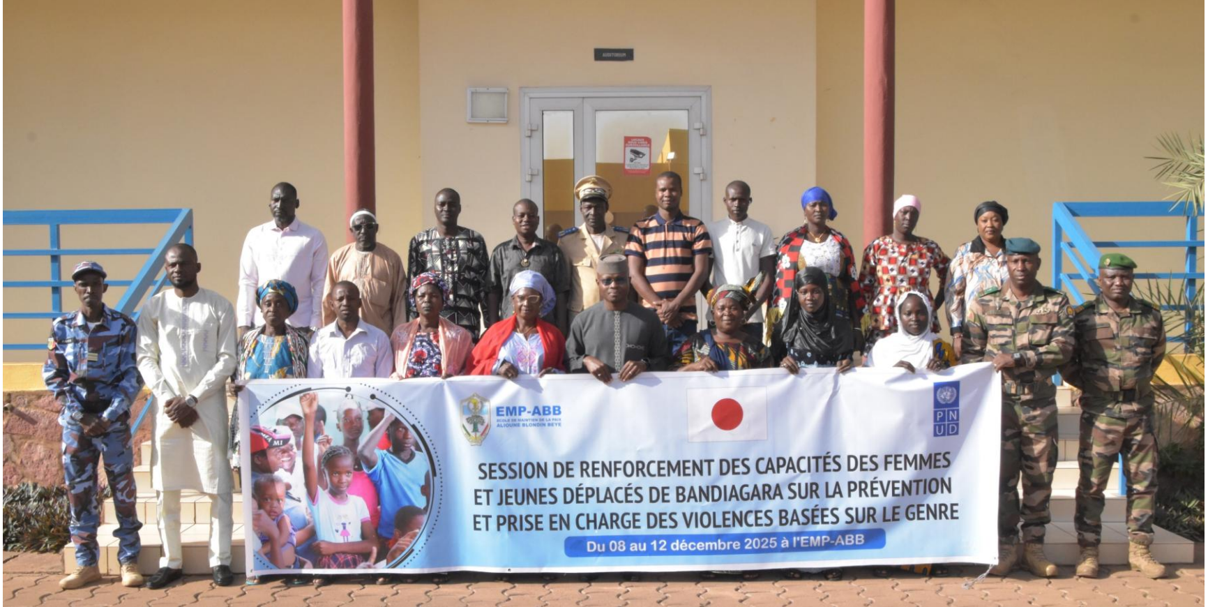
Prévention et prise en charge des VBG (JPN) EMP-ABB (Bamako, Mali) Du 08 au 12 décembre 2025