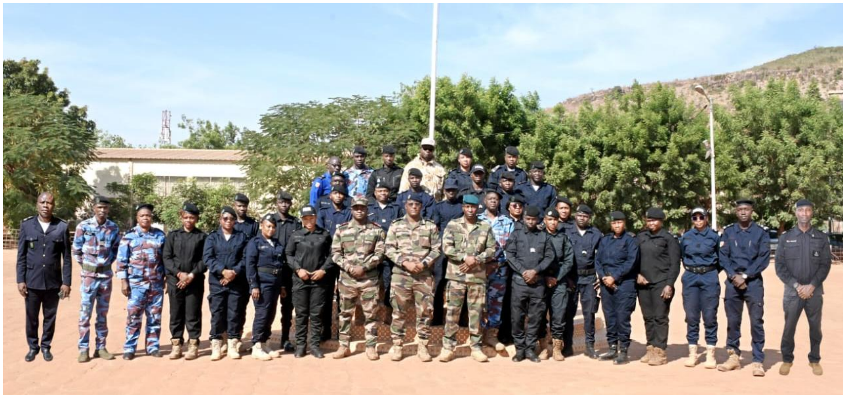
Police des Nations-Unies (UNPOL 4-25) ENP (Bamako, Mali) Du 24 novembre au 05 décembre 2025