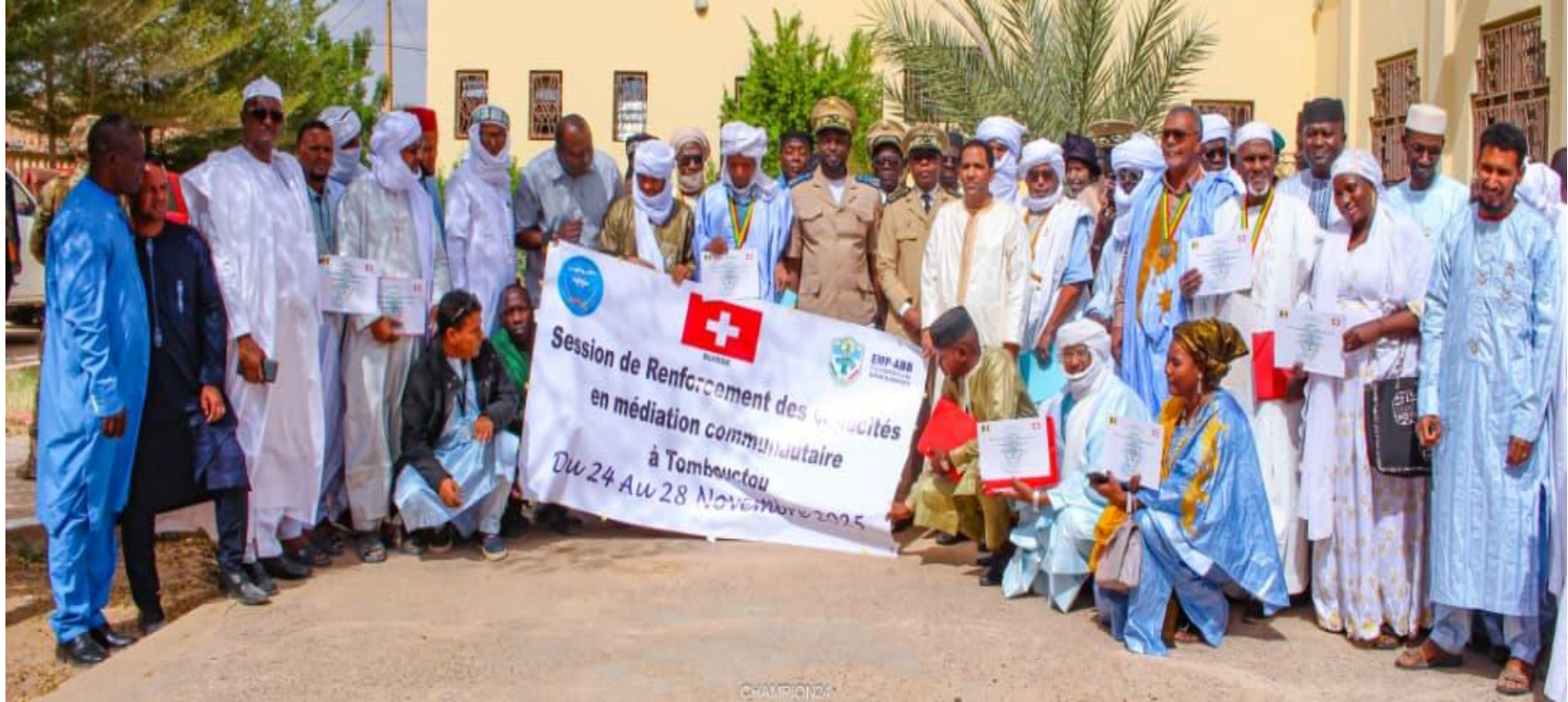
Médiation Communautaire (MC 3-25 SUI) Tombouctou (Mali) Du 24 au 28 novembre 2025