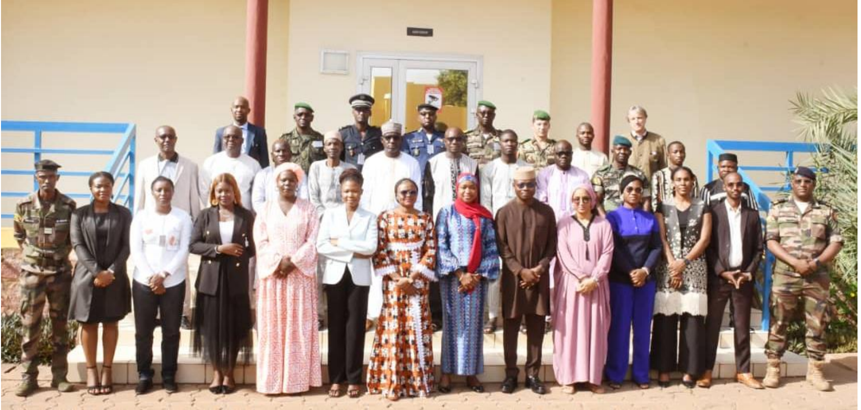
Médiation Politique et Communautaire (MPC 2-25 BEL) EMP-ABB (Bamako, Mali) Du 10 au 21 novembre 2025