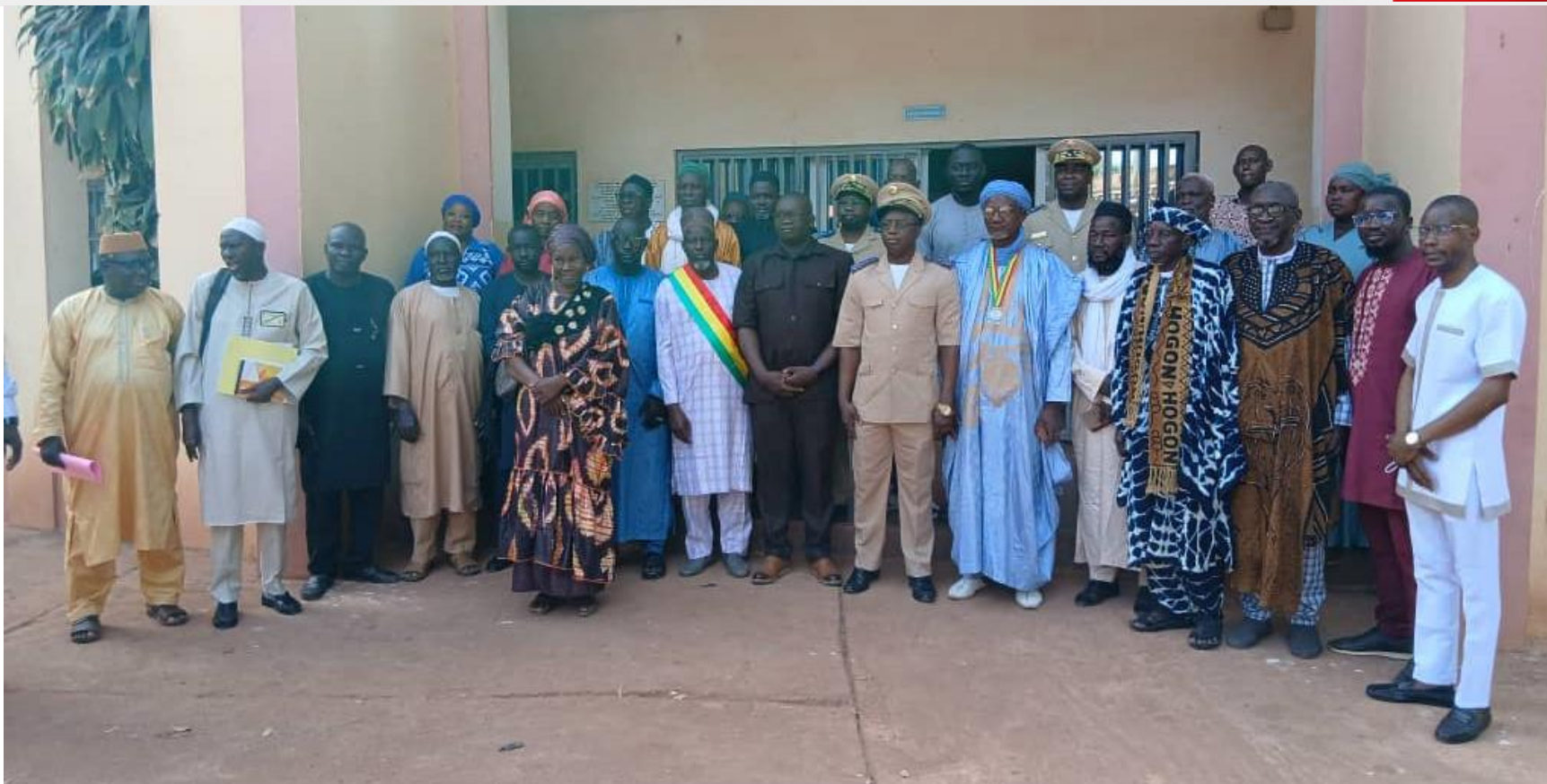
Médiation Communautaire (MC 2-25 SUI) Mopti (Mali) Du 22 au 27 novembre 2025