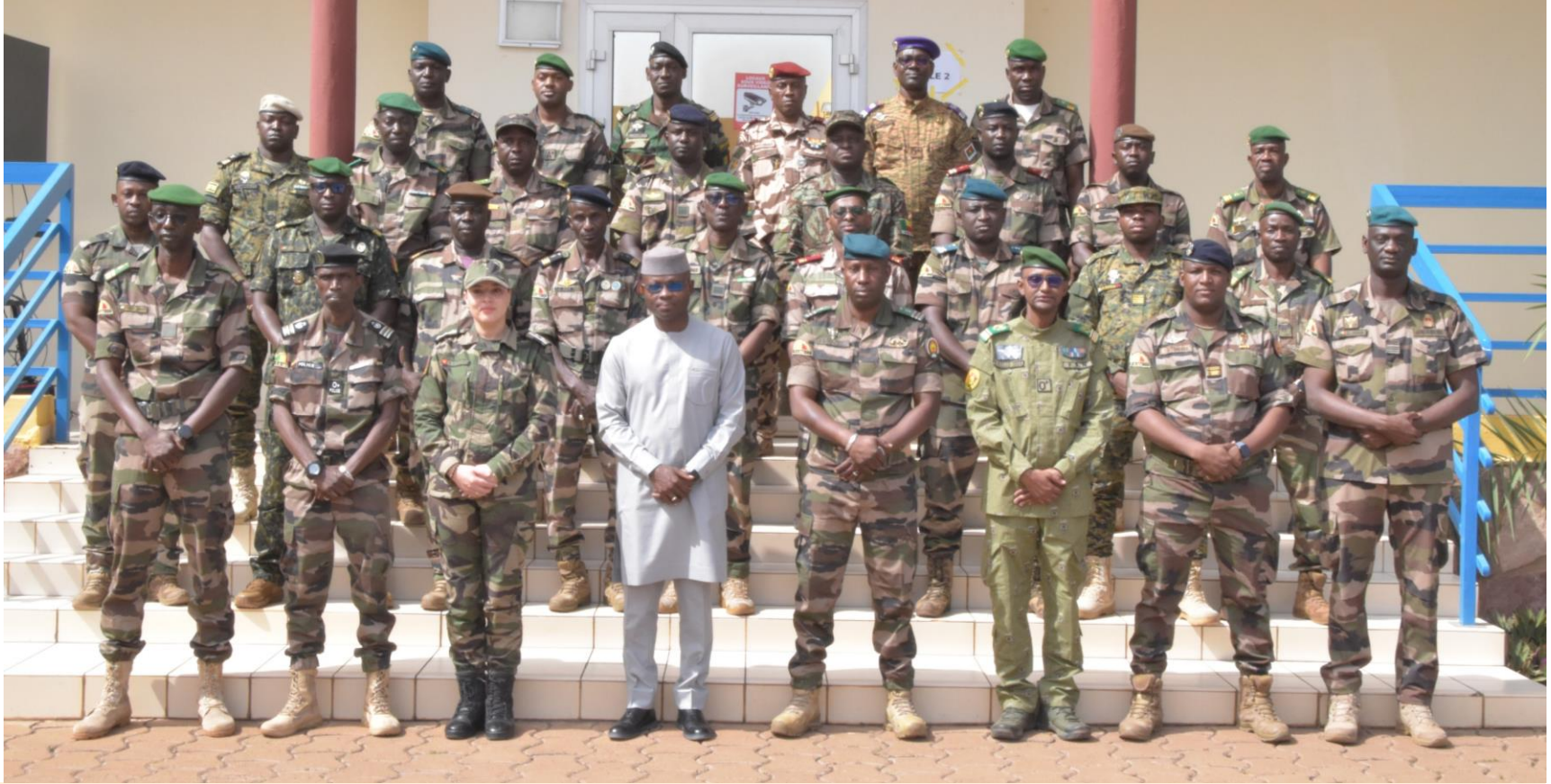
Observateurs Militaires des Nations-Unies (MILOBS) EMP-ABB (Bamako, Mali) Du 13 octobre au 07 novembre 2025