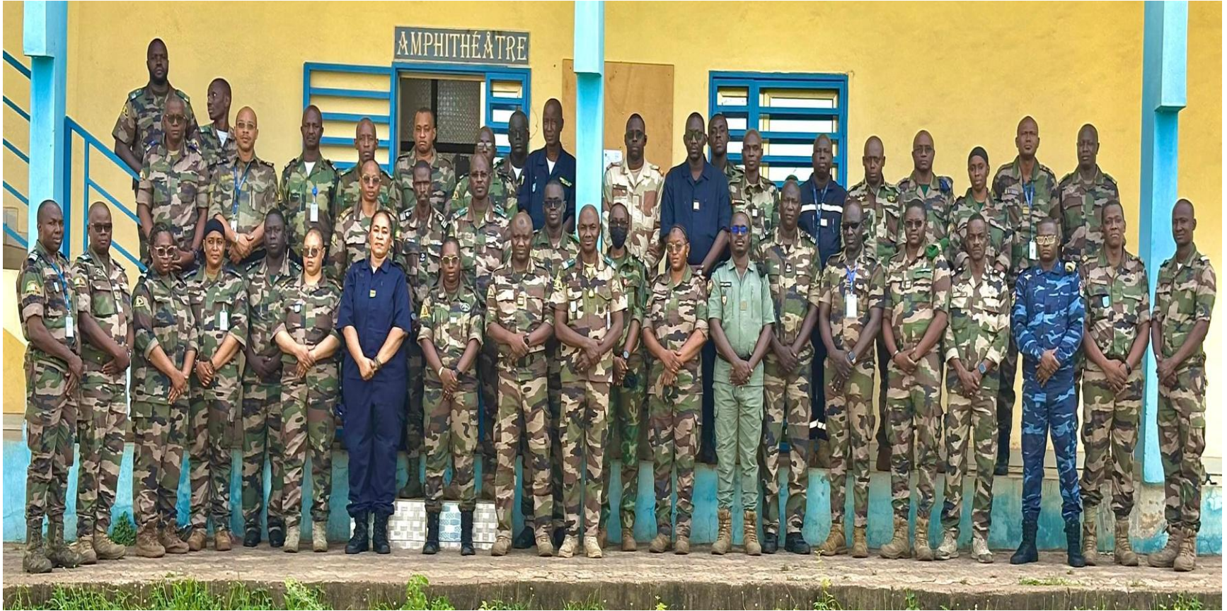
Poste de Commandement Bataillon (PC BAT 2-25 MALI) Ecole de Gendarmerie de Faladiè (Bamako, Mali) Du 02 au 13 Juin 2025