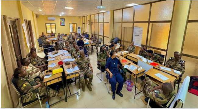
PC BAT 2-25 (MALI)

Poste de Commandement Bataillon (PC BAT)