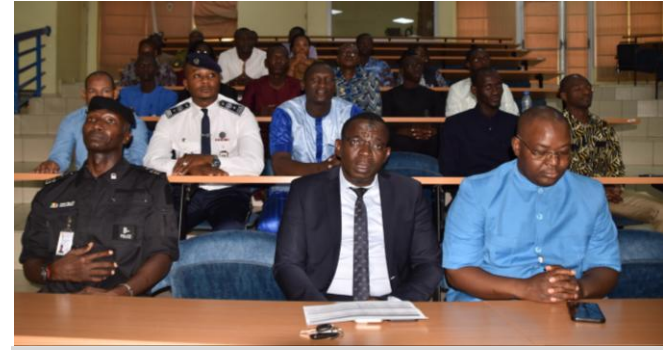
JT 2-25 (DEU)

Acquisition des connaissances et du savoir-faire indispensables aux officiers d'État-major de bataillon engagés dans une opération de paix de l'ONU ou de soutien à la paix de l'Union Africaine.