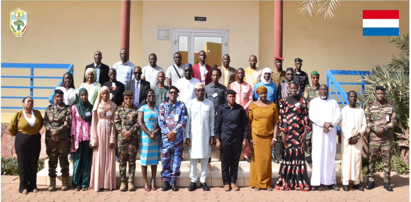
Droit et Protection des Enfants (DPE 1-25 NDL) EMP-ABB DU 17 AU 28 Février 2025