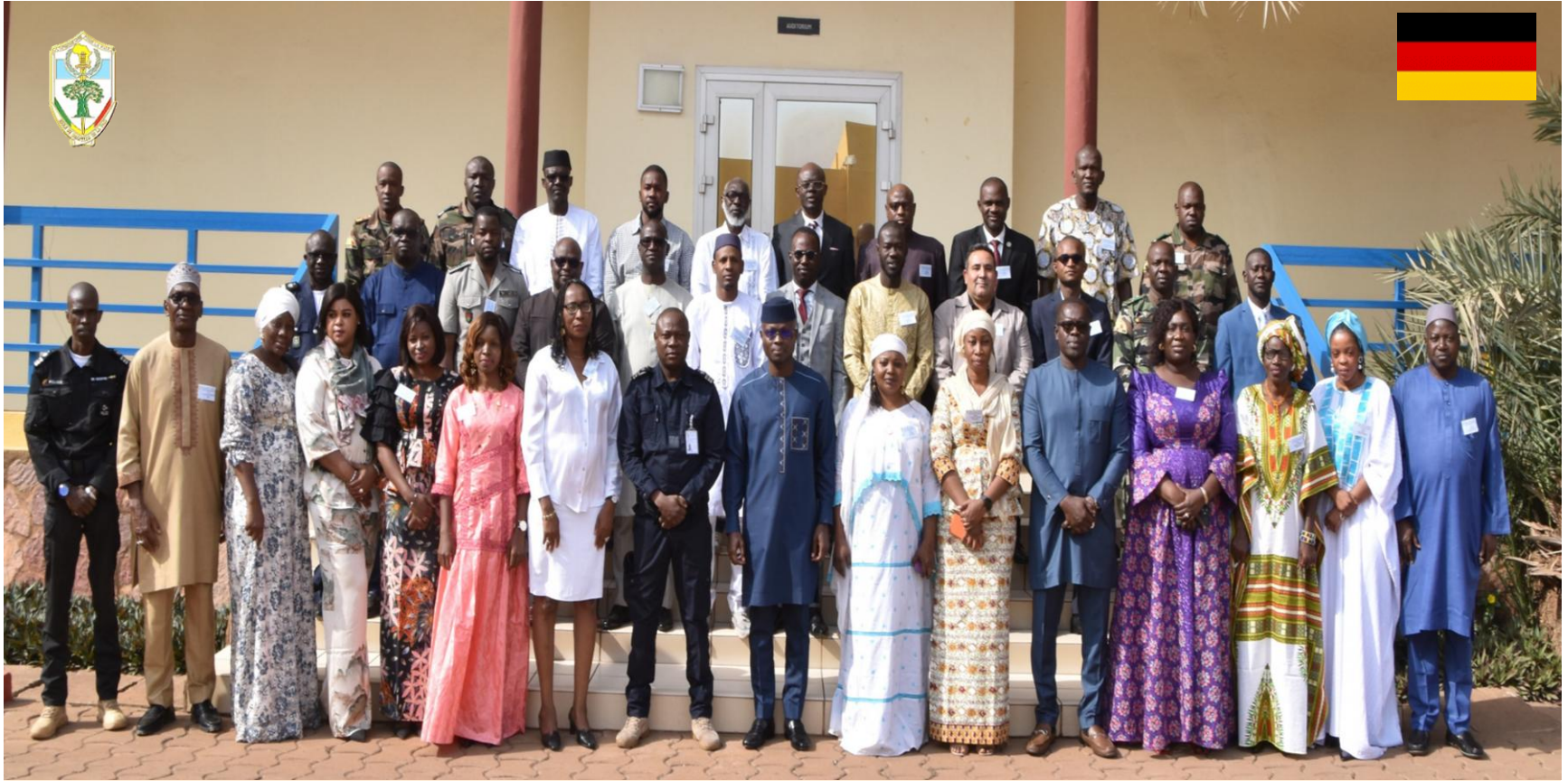
Appui au Processus Electoral (APE 1-25 DEU ) EMP-ABB DU 27 Janvier au 07 Février 2025