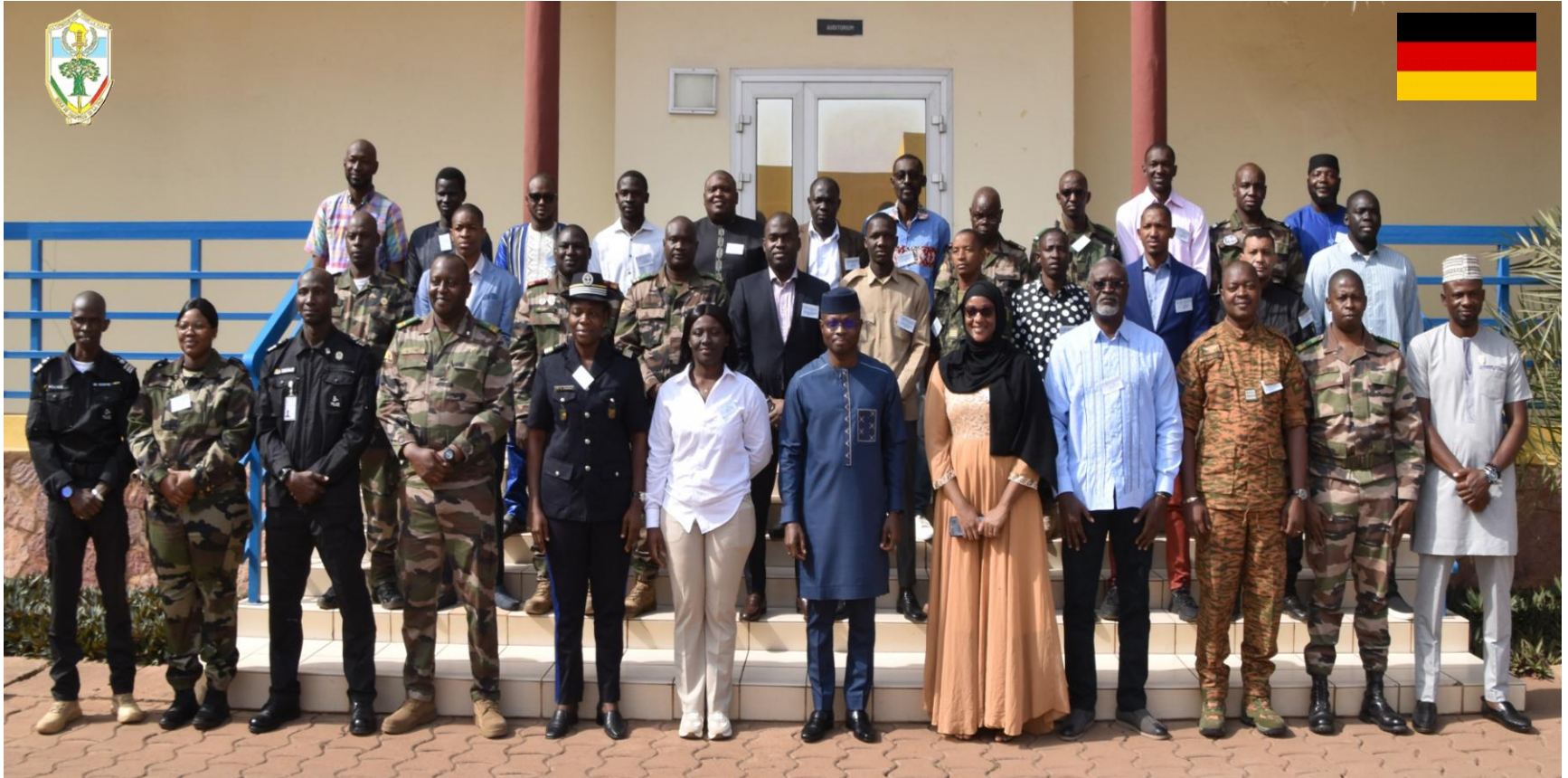
Logistique des Nation-Unies (UNLOG 1-25 DEU ) EMP-ABB DU 27 Janvier au 07 Février 2025