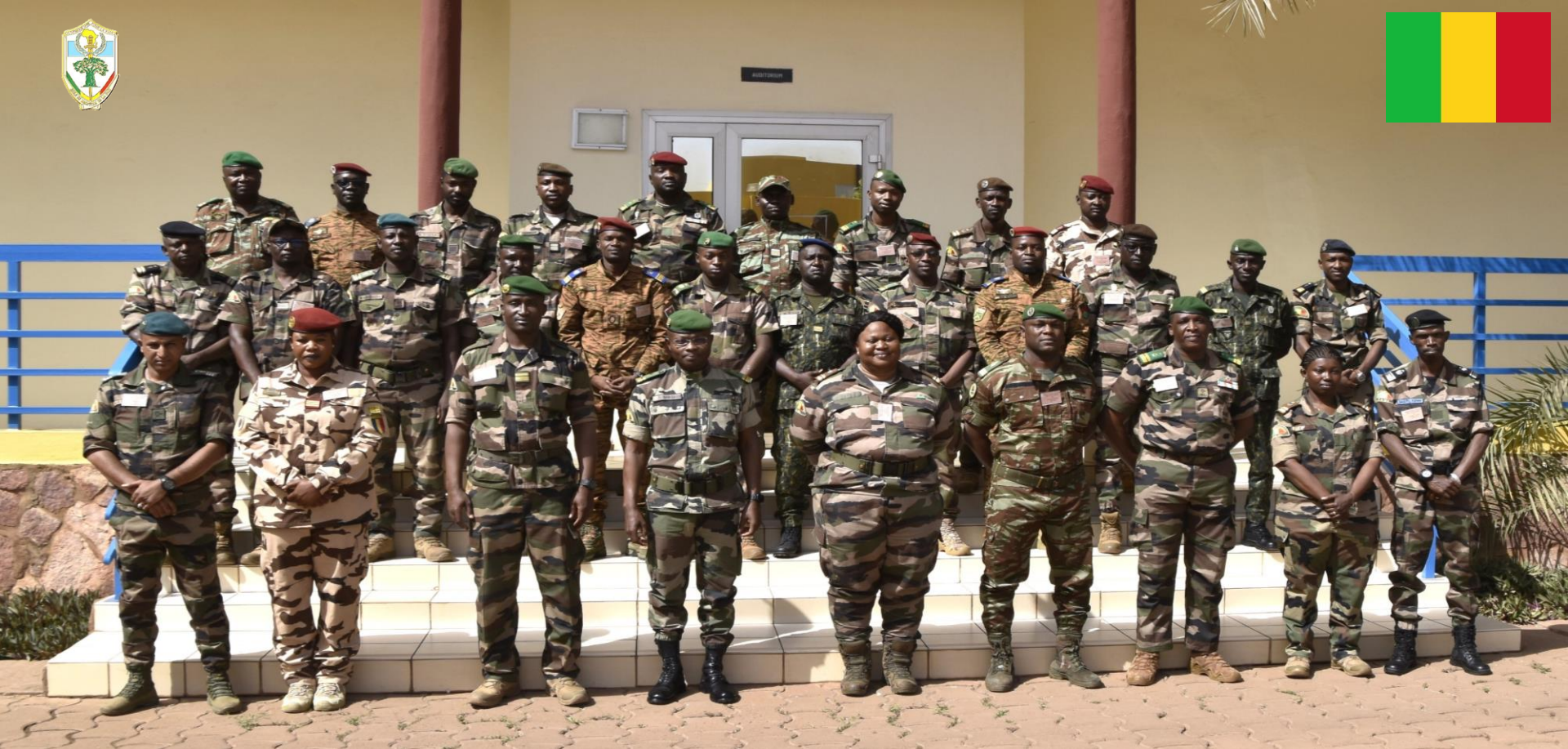
Poste de Commandement Bataillon – PC BAT EMP-ABB 11 – 22 Mars 2024