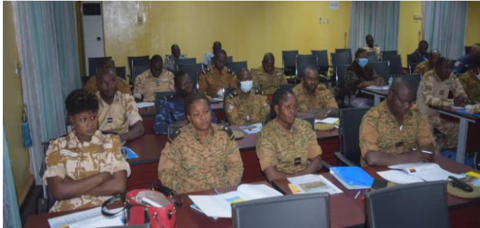
GRC BURKINA FASO

Gestion des Risques et Catastrophes (GRC)