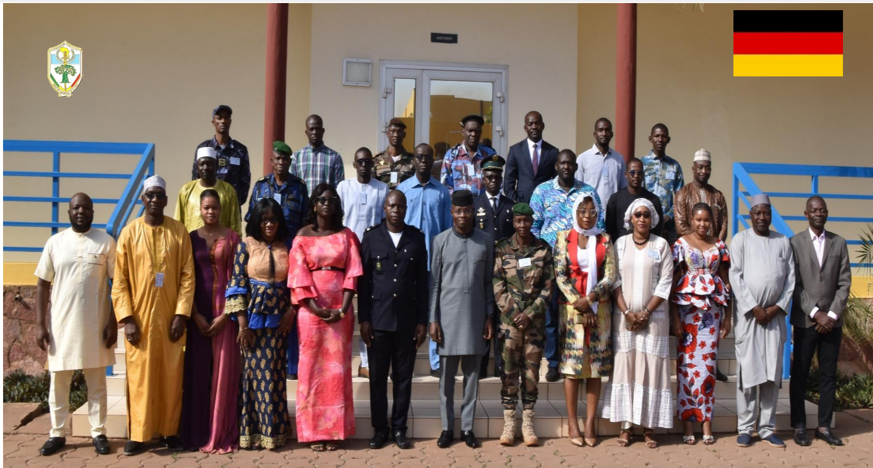
Appui au Processus Électoral - APE EMP-ABB 12 – 23 février