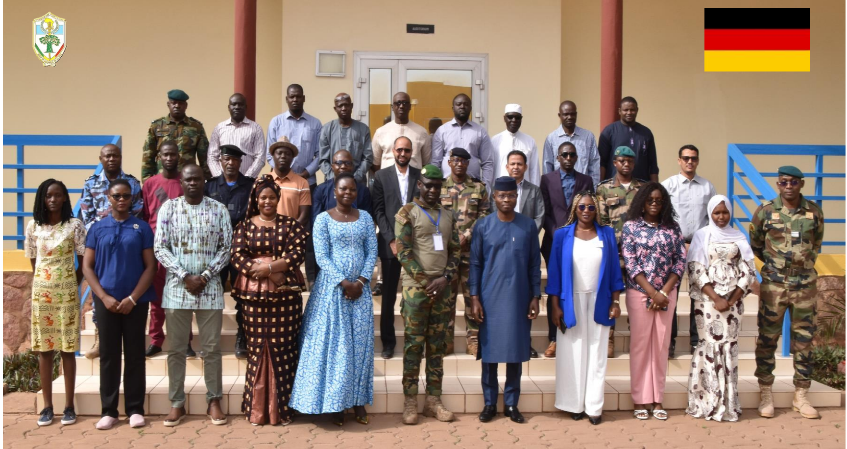
Protection des Civils - POC EMP-ABB 29 janvier – 09 février 2024