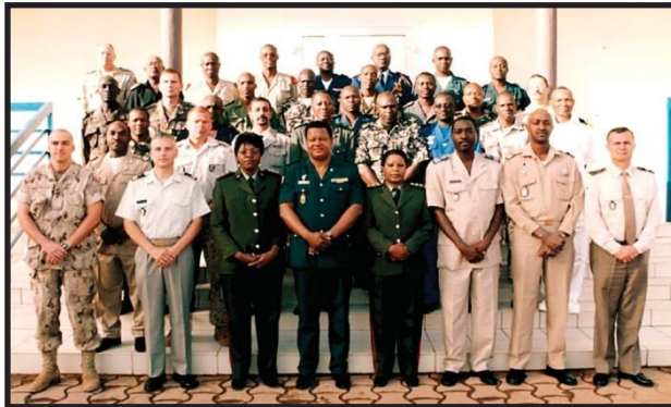
Foto de época: correspondiente a la EMP en el año de su inauguración (2007) en su actual emplazamiento en Bamako (en la imagen se observan autoridades, instructores y cursantes).

Finalmente, este artículo no pasaría de ser un documento referencial y/o de estadísticas, sino estuviese acompañado de un cuadro “vivencial” enriquecido por la experiencia “ in situ ” de quien esto escribe.